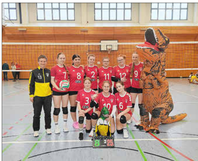
U20 beim Vogtlandpokal am 19.04.2026 mit „Dino“

Lange wurde nicht Trübsal geblasen, hatte der VfB doch bei der Siegerehrung mit dem neuen Maskottchen „Dino“ noch ein kleines Highlight zu bieten;-)