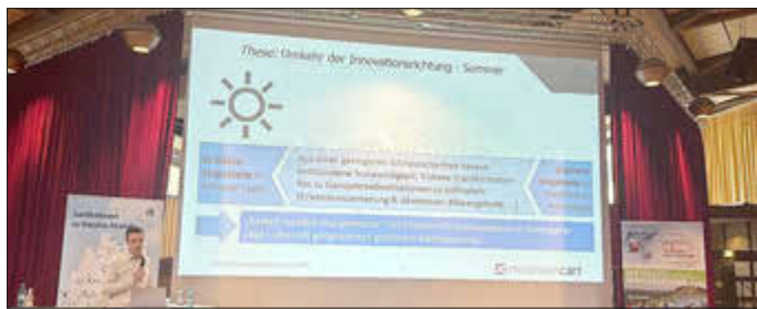
Tagung des Verbandes deutscher Seilbahner

Passend dazu durfte ich gemeinsam mit Vertretern unserer DLT GmbH an der VDS-Sommertagung am Wurmberg in Braunlage teilnehmen. Rund 70 Teilnehmer aus ganz Deutschland – Betreiber von Bergbahnen, Liftanlagen und touristischen Ganzjahresdestinationen – tauschten sich dort über aktuelle Entwicklungen, Herausforderungen und Zukunftsperspektiven der Branche aus.