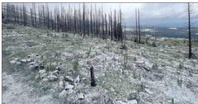
Deutliche Borkenkäferschäden am Wurmberg

Besonders beeindruckend war die Besichtigung der neuesten Entwicklungen am Wurmberg – und das bei dichtem Schneetreiben Ende Mai. Gleichzeitig wurde aber auch sichtbar, welche gewaltigen Schäden der Borkenkäfer in weiten Teilen des Harzes hinterlassen hat. Ganze Berghänge prägen inzwischen abgestorbene Waldflächen. Hier können wir durchaus dankbar sein, dass sich die Situation in unseren Wäldern bislang deutlich besser darstellt. Hoffen wir gemeinsam, dass unsere Wälder auch künftig erhalten bleiben und nicht durch fragwürdige politische Entscheidungen im Zuge der Energiewende zusätzlich unter Druck geraten.