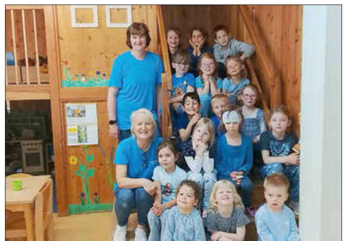
Montag war der „blaue Tag“