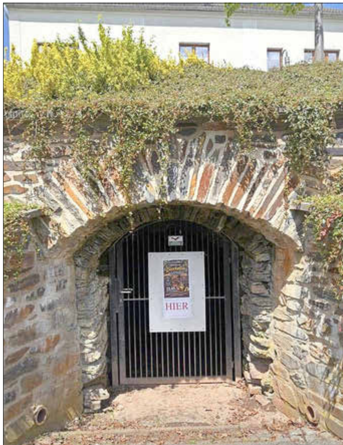
Bierkeller am Alten Söll

als Begegnungsorte für Einheimische und Gäste wahrgenommen werden. Ich freue mich bereits auf die kommenden Veranstaltungen und Aktivitäten an beiden Standorten.