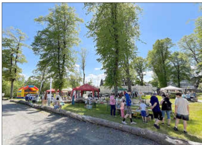
Buntes Treiben zum Pfingstbasar

Ich hoffe, Sie alle konnten das Pfingstwochenende nutzen, um einmal durchzuschlafen und Kraft für die kommenden Wochen zu tanken. Frei nach Johann Wolfgang von Goethe: „Nichts ist schwerer zu ertragen als eine Reihe von guten Tagen.“