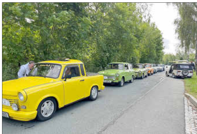
Trabi-Korso in Schöneck