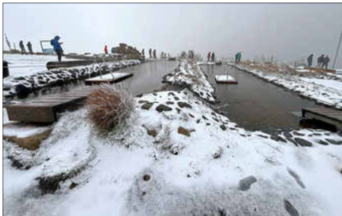
Das neue Wasserspielparadies befand sich noch im Winterkleid.