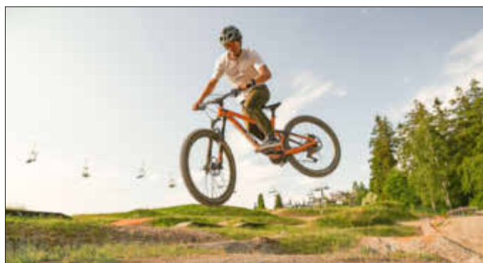
Übungsparcours der Bikewelt Schöneck