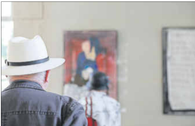
Alle Kunst will Musik werden.