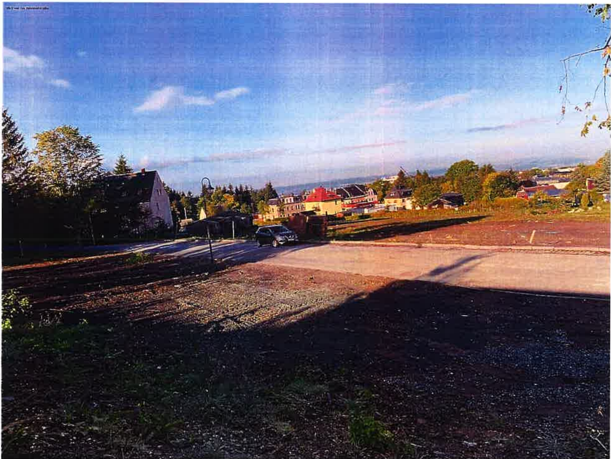
Abbildung A Blick von der Bahnhofstraße