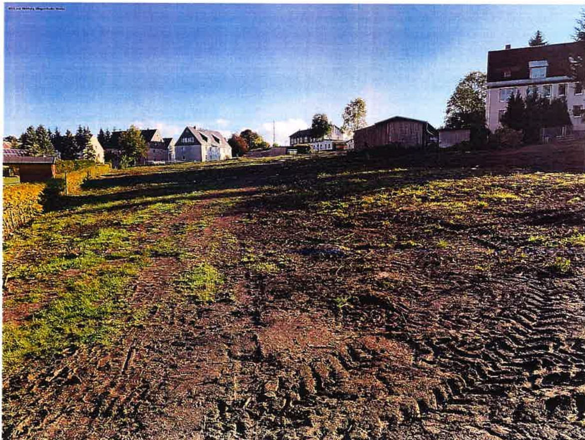
Abbildung C Blick von der Klingenthaler Straße