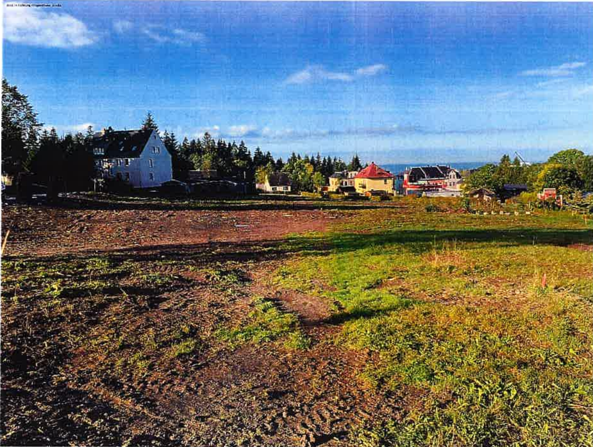
Abbildung B Blick in Richtung Klingenthaler Straße