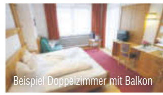
Beispiel Doppelzimmer mit Balkon