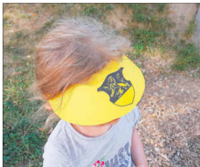
Auch unsere Kita hat geschmückt