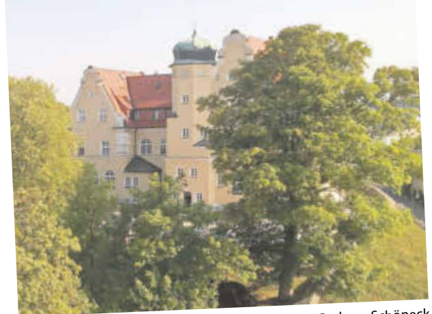
Rathaus Schöneck