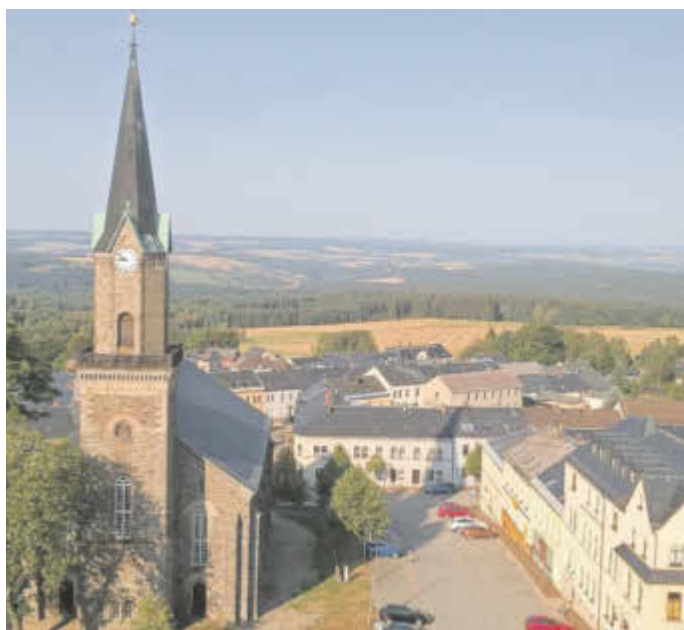
Blick vom Alten Söll auf Schöneck

Hauptstraße 46 - 08261 Schöneck Tel. 03 74 64 / 86 37 95 www.technimarkt.de