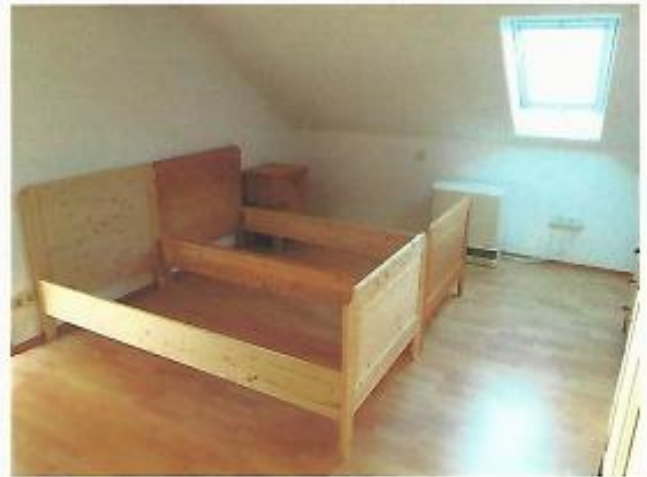
Schlafzimmer, von Wohnzimmertür aus betrachtet