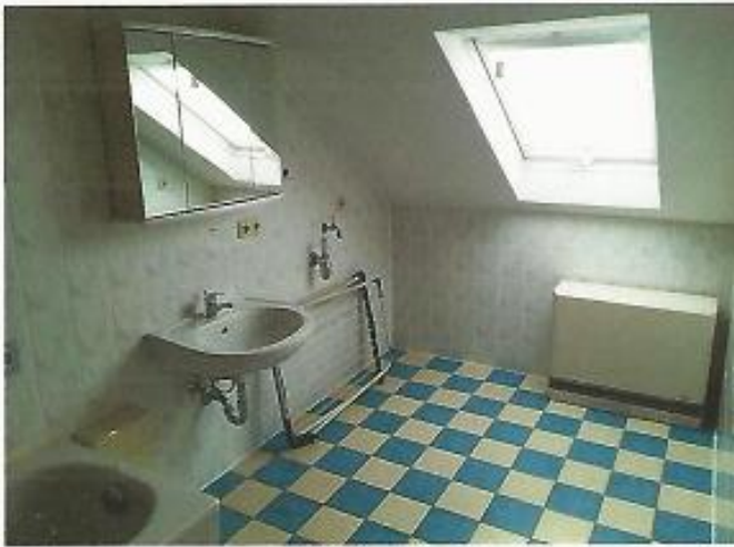
Bad, mit Blick zum Standort für WA und TR