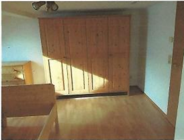
Schlafzimmer, von Badtür aus betrachtet