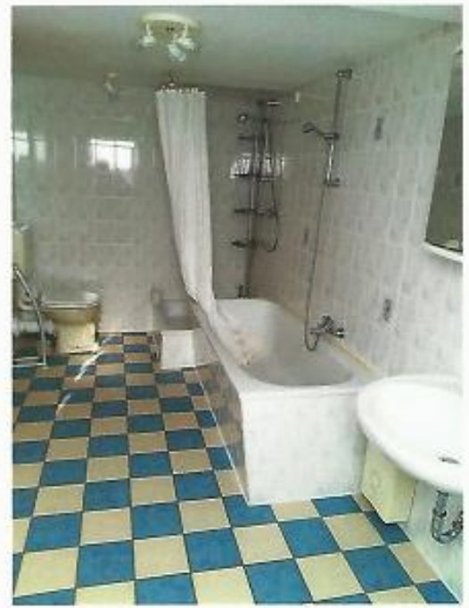
Bad, Blick nach innen zu Wanne Dusche und WC