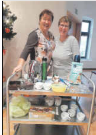
Danke an die tollen Omas mit Ideen und Pfiff

Die „ Weihnachtsgans Auguste “ wird am 5. Dezember 17.00 Uhr im Bürgerhaus über die Bühne watscheln und entkommt zum Glück durch die Hilfe vieler Kinder, dem Opernsänger Luitpold, der sie ja als Weihnachtsbraten gekauft hatte ... Apropos Opernsänger. Natürlich spielt die Musik wieder eine wichtige Rolle. So sind z. B. auch TRIOLAKinder aus dem Kindergarten Sonnenwirbel mit dabei um ein paar Weihnachtslieder auf ihrem Instrument zu spielen. Mit viel Spielfreude und Lust am Verkleiden werden wir mit dieser beliebten Geschichte auch in diesem Jahr für eine wunderbare und fröhliche Festtagseinstimmung sorgen. Eine schmunzelvolle Geschichte für Groß und Klein und „alte Theaterhasen“. Lassen Sie sich/lasst Euch einladen zu unserer vorweihnachtlichen Geschichte von der „Weihnachtsgans Auguste“ im Bürgerhaus Schöneck mit den Theaterkindern der Grundschule Schöneck . Der Eintritt ist frei. Wenn Sie unsere Arbeit gern mit einer Spende unterstützen wollen, können Sie das sehr gern am Ausgang tun. Wir freuen uns auf Sie und Euch und bleiben Sie neugierig!