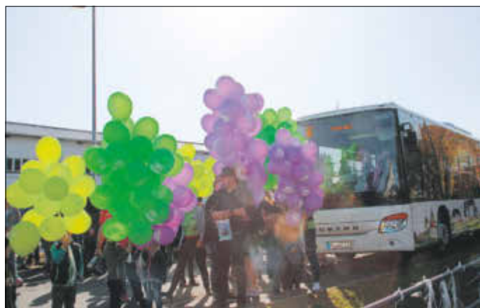
Zum Start des „Vogtlandnetz 2019+“ stiegen bunte Ballons auf.

Mit PlusBus, TaktBus, StadtBus, RufBus und BürgerBus sowie mit dem Schülerverkehr erschließt das Netz die Orte und Ortsteile des Vogtlandes. Neue Wohngebiete oder Gewerbegebiete werden nun angefahren, 112 neue Haltestellen wurden im Vogtland eingerichtet.