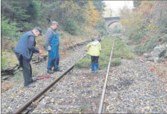
Der Unterschied und die dritte Brigade

Ja, es ist ruhig, zurzeit kein PersonenZugverkehr auf der Strecke Zwotental - Adorf. Es gibt keine Fahrzeuge, der Markt leer. Und selber Fahrzeuge anschaffen, scheitert noch am fehlenden Geld. Aber es gibt Positives, der Streckeninhaber RIS hat eine Brücke „unterfangen“ und zwei Schichten gefahren, Vegetation wurde zurückgeschnitten. In den kommenden Tagen wird hierzu nochmals durchgeführt und weiter beschnitten. Unser Verein hat in 2 Einsätzen 3 km von Fichtenanflug befreit. Die Beteiligung war gut, es gab auch 2 Erlbacher, der die Strecke auch am Herzen liegen und gut zapackten.