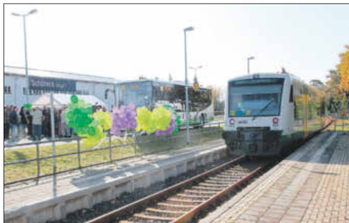
Am Bahnhof Schöneck wurde nicht nur der Start des „Vogtlandnetz 2019+“ gefeiert, hier kann man künftig auf kurzem Weg zwischen Bus auf Bahn umsteigen.

Weiterhin stehen Ihnen die VVV-Info-Aufsteller in der Touristinfo Schöneck, im Infopoint am Museumscafé, bei HR Moden in der Hauptstraße 43 und im Rathaus Schöneck mit allen Busfahrplänen zur Verfügung.