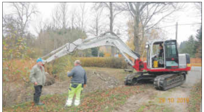
Bernd Ebert im Gespräch mit unserem Bauhofleiter Jens Spranger

Mitte der 1990er-Jahre wurde letztmalig der Stadtteich geschlammung. Zwischenzeitlich war das Gewässer stark bewachsen und der Uferbereich beschädigt. Nach dem Mittel in den Haushaltsplan 2019/20 eingestellt waren, wurde die Schlammung unter Einbeziehung der entsprechenden Fachbehörden und mit fachkundiger Beratung durch Herrn Bernd Ebert geplant. Dazu wurde u.a. im letzten Jahr der Schlamm beprobt mit dem Ergebnis, dass dieser schadstofffrei ist und für die Dammbefestigung und dem Ausgleich der Uferzone verwendet werden kann.