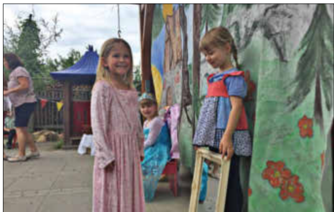
Besuch der tschechischen Freunde bei uns