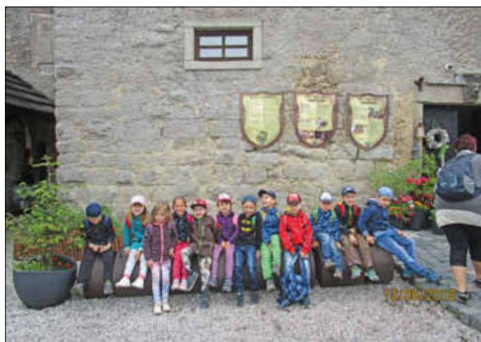
Besuch der Burg Skalna

Bei einem schmackhaften Essen ließen wir dann den Vormittag in der Burg ausklingen.